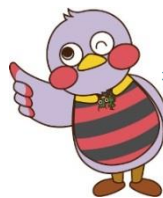
埼玉県マスコット「さいたまっち」

URL http://www.pref.saitama.lg.jp/a0808/rodoseminar/index.html