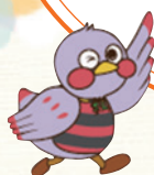
埼玉県のマスコット 「さいたまっち」