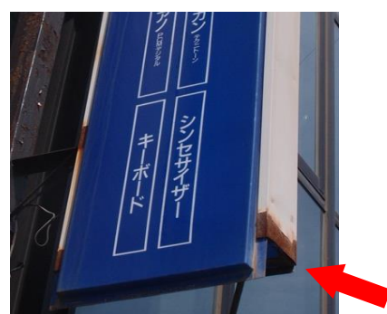
表示板が抜け落ちるかも☹️