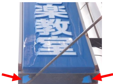
腐食して穴が開いています☹️

日ごろのチェックも必要ですが、 目安として設置後 10 年以上経過した看板は、 専門家の点検を受けるようにしましょう。 ※年数を問わず専門家の点検を義務付けている自治体もあります。