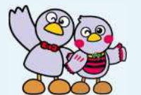
埼玉県のマスコット 「コバトン」「さいたまっち」

※ 交付決定後に対象となる取組を実施し、就業規則の作成又は改正を行う場合が対象となります。