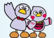
埼玉県のマスコット 「コバトン」「さいたまっち」

※ 交付決定後に対象となる取組を実施し、就業規則の作成又は改正を行う場合が対象となります。